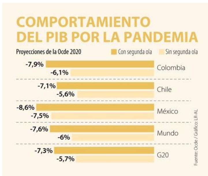
Gráfico 1. Decrecimiento económico en 2020, según la OCDE. Diario La República, 11 de junio de 2020.

El presente y el futuro inmediato están signados por la difícil circunstancia de la pandemia del coronavirus. Es una coyuntura económica de difícil interpretación, la más incierta en los últimos tiempos. Si bien en el ámbito de las ciencias económicas se dice que la estabilidad es tal vez el producto más escaso, la realidad indica que los Estados en su conjunto deben intervenir profundamente sus economías para prevenir una debacle sin precedentes, en medio de pésimos pronósticos. A pesar de las diferencias entre las entidades financieras e instituciones económicas -OCDE, FMI, CEPAL, Banco Mundial- lo que da una idea de la incertidumbre, todas coinciden en señalar una fuerte depresión de la economía mundial, que no habrá países indemnes y que los indicadores de empleo, lucha contra la pobreza y bienestar general sufrirán deterioros severos: retrocederemos varias décadas en los logros económicos e indicadores de desarrollo alcanzados.