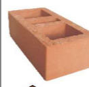
Ladrillo catalán 10x15x40

PV, no estructural Liso Dimensiones nominales [cm]: 10x15x30 Dimensiones reales [cm]: 9,3x14,2x29,7 Peso [kg]: 3,4 Rendimiento [Und/m 2 ]: 31,6 Peso m 2 sin acabado [kN/m 2 ]: 1,26 Peso m 2 con acabado de 1 cm en una cara [kN/m 2 ]: 1,46 Peso m 2 con acabado de 1 cm en ambas caras [kN/m 2 ]: 1,66 Consumo mortero de pega [m 3 /m 2 ]: 0,0102 Resistencia a la compresión [f'cu] [MPa]: 30,64 Absorción de agua [%]: 19,05