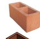
Ladrillo castellano 12x13x30

PV, no estructural Liso Dimensiones nominales [cm]: 10x15x40 Dimensiones reales [cm]: 9,5x14x39 Peso [kg]: 4,8 Rendimiento [Und/m 2 ]: 23,8 Peso m 2 sin acabado [kN/m 2 ]: 1,31 Peso m 2 con acabado de 1 cm en una cara [kN/m 2 ]: 1,51 Peso m 2 con acabado de 1 cm en ambas caras [kN/m 2 ]: 1,71 Consumo mortero de pega [m 3 /m 2 ]: 0,00902