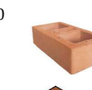
Ladrillo bocadillo 6x12x24

PV, no estructural Liso Dimensiones nominales [cm]: 12x13x30 Dimensiones reales [cm]: 11,7x12,3x29,4 Peso [kg]: 3,7 Rendimiento [Und/m 2 ]: 24,7 Peso m 2 sin acabado [kN/m 2 ]: 1,04 Peso m 2 con acabado de 1 cm en una cara [kN/m 2 ]: 1,24 Peso m 2 con acabado de 1 cm en ambas caras [kN/m 2 ]: 1,44 Consumo mortero de pega [m 3 /m 2 ]: 0,00739 Resistencia a la compresión [f'cu] [MPa]: 19,16 Absorción de agua [%]: 18,37